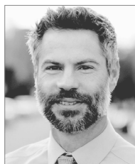
マイケル・シェレンバーガー エンパイロメンタル・プロGRESS代表 「原子力、パニック、そして危険性」